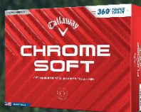
CHROME SOFT 360° TRIPLE TRACKボール 【価格】 オープンプライス