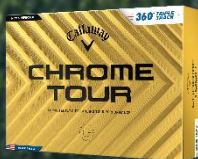
CHROME TOUR 360° TRIPLE TRACKボール 【価格】 オープンプライス