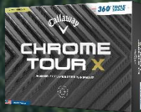
CHROME TOUR X 360° TRIPLE TRACKボール 【価格】 オープンプライス