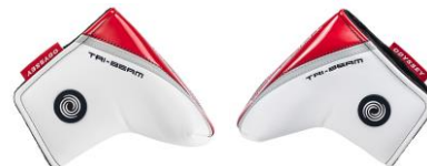
DOUBLE WIDE, DOUBLE WIDE CS