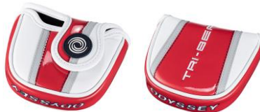
#7, #7 CS